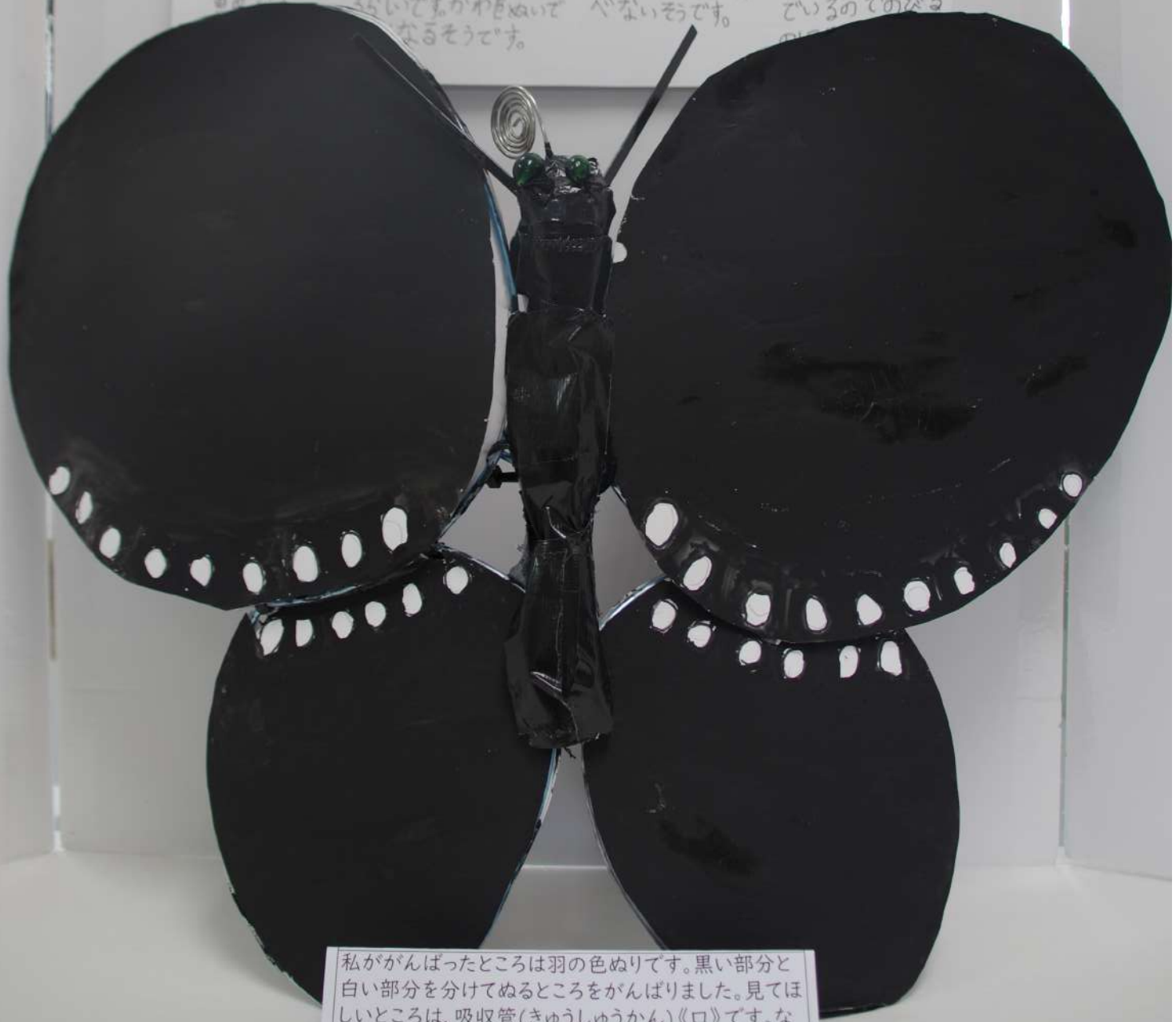
私がかんばったところは羽の色ぬりです。黒い部分と白い部分を分けてぬるところをかんばりました。見てほしいところは、吸尿管(きゅうしゅうかん)《口》です。なぜなら作るのがむずかしかったからです。