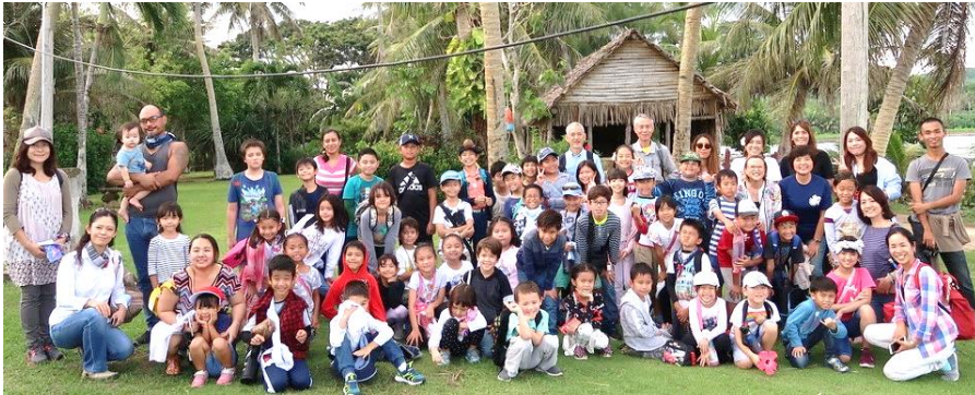
Gef Pa'go Chamorro Village で (プリ、小1~小4)

9/28(土)、待望 たいぼう の校外学習 こうがいがくしゅう を行うことができました。PTA・保護者 ほごしゃ の皆さま みな 、ご協力 きょうりょく ありがとうございました。なかでも、当日ボランティア とうじつ で引率 いんそつ を補助 ほじょ して下さった方々 かたがた 、本当にありが ほんとう ありがとうございました。子どもたちもグアムについて楽しく学 まな ぶことができましたようです。