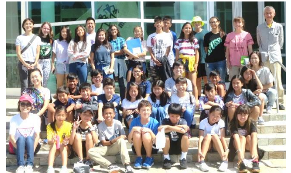
Guam Museum 前で (小5~中3)